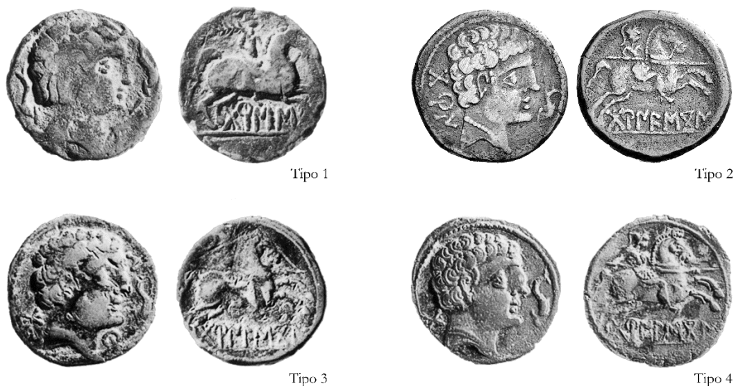
Figura 1. Emisiones de la ceca de Bormes (García-Bellido/Blázquez, 2001; Estarán/Beltrán, 2015).

Dos monedas proceden de ambientes romanos de la ciudad de Clunia, y una de ellas procede de un tesoro del cerro del Cuerno 112 . Se trataría de monetario residual llegadas a la circulación muy posteriormente a su acuñación 113 , hecho similar a los ejemplares de Tiermes procedentes del canal norte del acueducto 114 y del conjunto rupestre sur 115 . Solamente encontramos en la necrópolis de Carratiermes un ejemplar 116 .