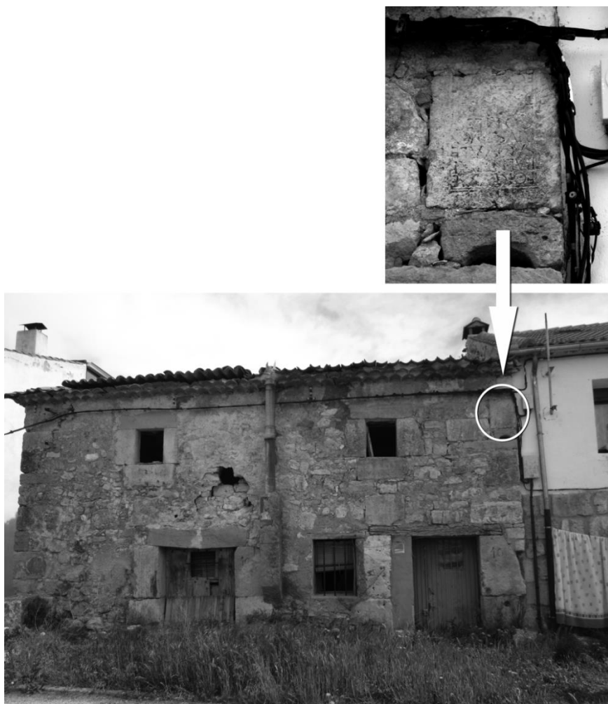
Figuras 1-2. Calle Ronda 10 del pueblo de Duratón (Segovia) y estado original del altar.