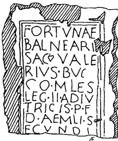
Figuras 4 y 5. CIL, II: 2763; Knapp, 1992: lám. 21.

FORTVNAE BALNEARI SA·Q·VALE RIVS·TVC CO·MILES LEG·II·ADIV TRICIS·P·F D·AEMILI·S ECVNDI