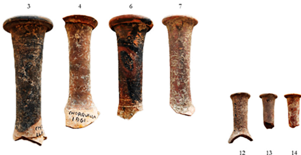
Figura 5. Ungüentarios cerámicos del vertedero legionario de «La Chorquilla».

Número de inventario : H61/CHO/1/160 / Procedencia : Herrera de Pisuerga. La Chorquilla. Depositado en el Museo de Palencia. / Descripción : fragmento de cuello de fuste estriado de un ungüentario con borde aplicado, quebrado por el estado actual de la pieza. El labio, redondeado, genera un anillo en torno a la boca como sucede en otros ejemplares (H61/CHO/156). Superficie irregular, Munsell 7.5YR 5/3. Restos de tratamiento. / Dimensiones : ø borde: 23,77. Altura: 39,09 mm. / Pasta : fina, decantada y homogénea. / Tipología : Lattara UNGUENT D2; Loeschke, 1909, 30; Loeschke, 1942, 28; Vegas 63b. / Lugar de producción : ¿italico? / Cronología : augustea-claudia. / Bibliografía : García y Bellido et al. , 1970: 14, Fig. 13.2.