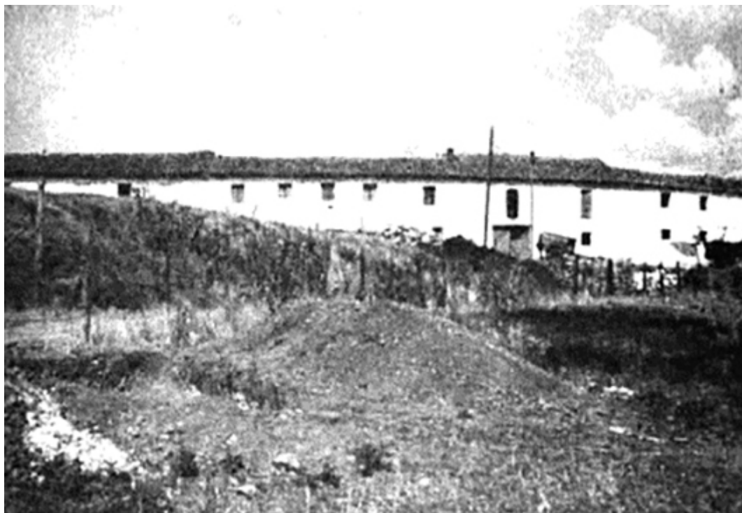
Figura 2. «La Chorquilla» (en primer término). Fotografía de A. Balil en 1960 (García y Bellido, 1961: 108, Fig. 52.a).

«En la campaña de 1961 siguieron saliendo de este denso yacimiento gran número de tiestos de cerámica romana, algunos de gran importancia. Parece haber sido un vertedero al que fueron a parar restos de vajillas cerámicas pertenecientes a la Legio IIII Macedonica y a sus oficiales, a juzgar por la riqueza de algunas de las piezas halladas. Conviene recordar que La Chorquilla no es un yacimiento estratificado, sino un vertedero en el que se arrojaron de una sola vez un material de deshecho ( sic. ) procedente a su vez y al parecer de un solo sitio. De ahí su homogeneidad y sincronía. Y de ahí, también, que hayan aparecido mezclados los tiestos cerámicos ya presentados con otros [restos]» (García y Bellido, Fernández de Avilés y García Guinea, 1970: 4-5, 21).