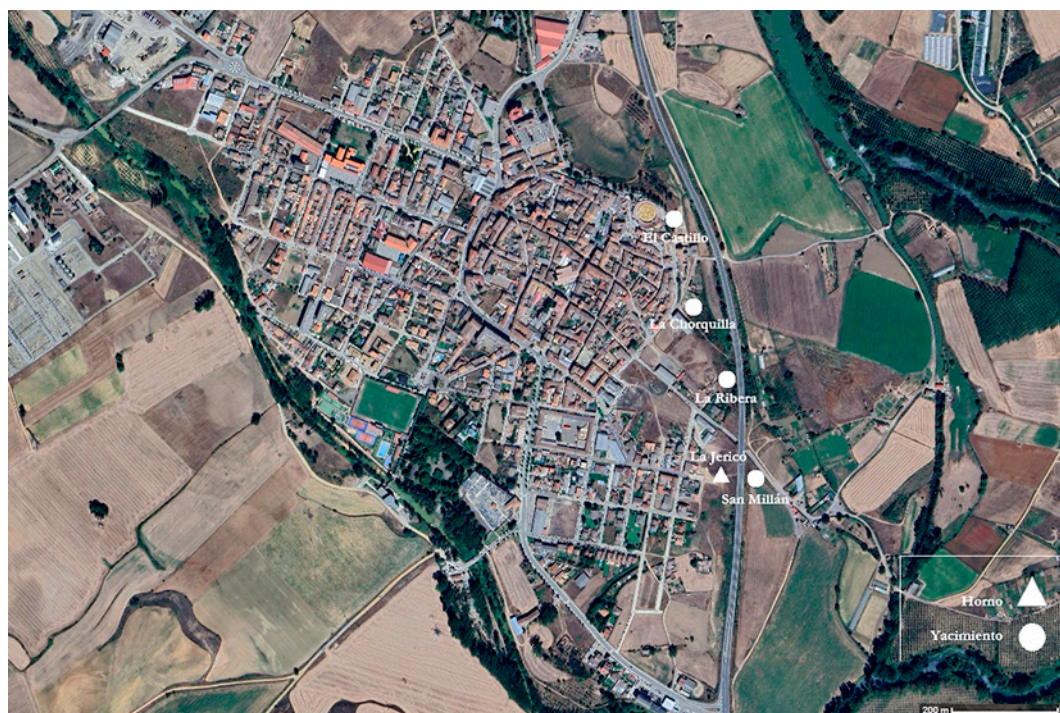
Figura 1. Vertederos romanos en el área este de Herrera de Pisuerga (Palencia, España).

«El yacimiento parece estaba cercano a la ciudad antigua (...). La cata principal nos llevó a una profundidad de unos 3 m. Vimos en ella unas capas de cal blanca y de cenizas, pero no pudimos hallar una muestra de estrato claro, ofreciendo (...) el aspecto de un vertedero en declive (Fig. 2). La capa rica en hallazgos era la de cenizas (...). Tratándose de una cata de prospección, al no hallar restos o indicios arquitectónicos que diesen pie para iniciar una excavación sistemática, abandonamos pronto esta inspección para tantear en otros lugares más generosos o prometedores (...). No obstante, hemos de hacer constar que es zona rica en hallazgos sueltos, sobre todo cerámicos. De aquí sacamos casi todos los fondos de cuencos de terra sigillata con marca del figlinarius de la Legio IIII Macedónica, L. Terentius » (García y Bellido, 1961: 33).