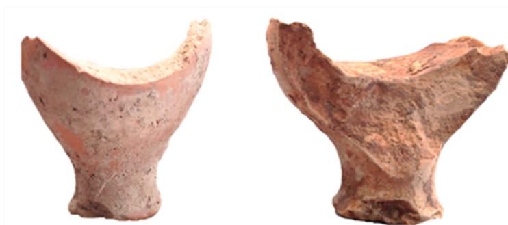
Figura 3. Ungüentarios con pie corto (números 1-2 del catálogo).

Número de inventario: H61/CHO/1/59 / Procedencia: Herrera de Pisuerga. La Chorquilla. Depositado en el Museo de Palencia. / Descripción: pie e inicio del