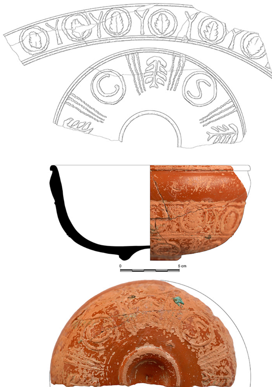
Figura 2. Terra sigillata hispánica de Herrera de Pisuerga con epigrafía intradecorativa.