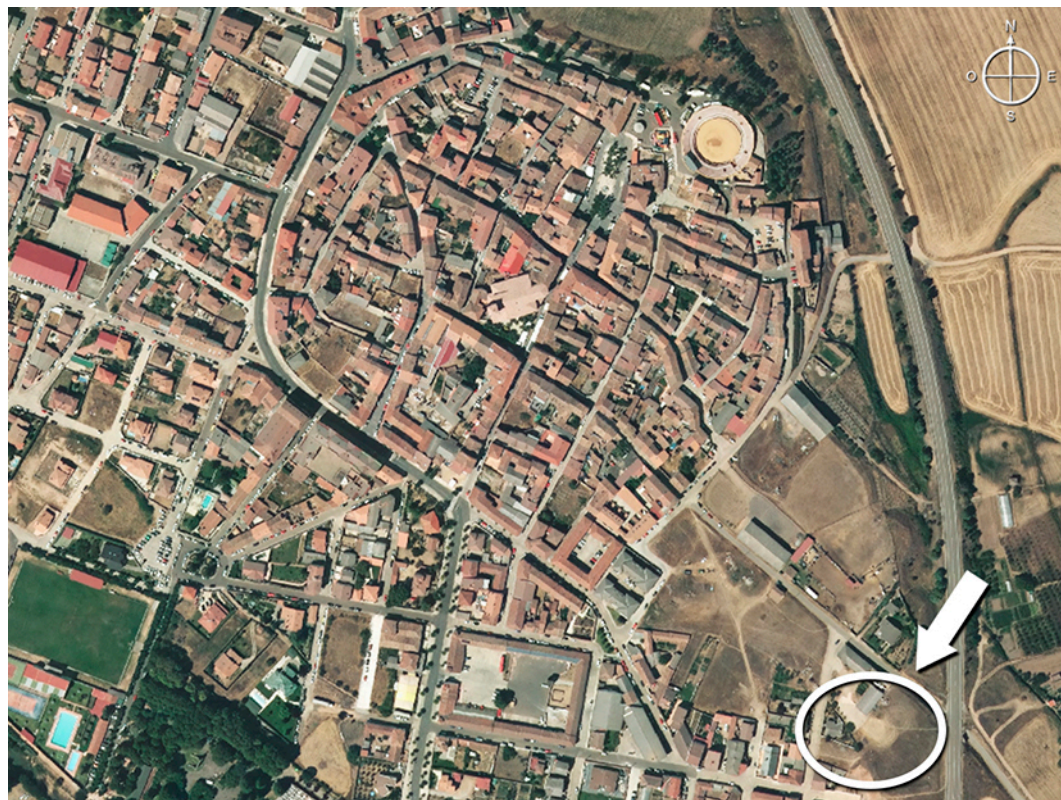
Figura 1. Localización de las Eras Bajas, al suroeste del casco urbano de Herrera de Pisuerga.